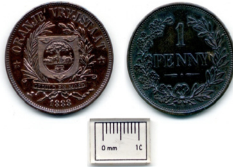
Figuur 1: Vrystaatse patroonmunt van 1888, deur Otto, Nolte & Kie van Berlyn