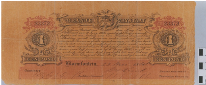
Figuur 3: Vrystaatse £1-regeringsnoot, Mei 1868