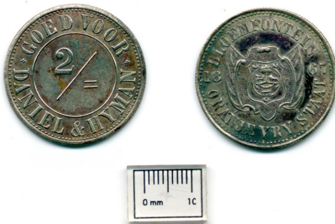
Figuur 5: Daniel & Hyman-tekenmunt, Bloemfontein, 1867