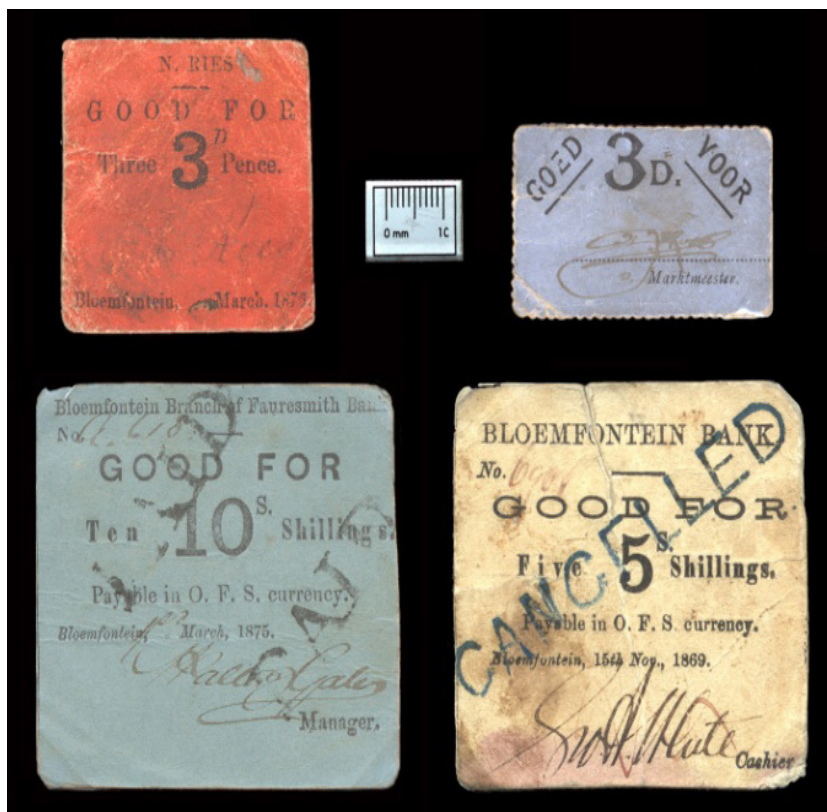
Figuur 4: Enkele Vrystaatse goedvoors