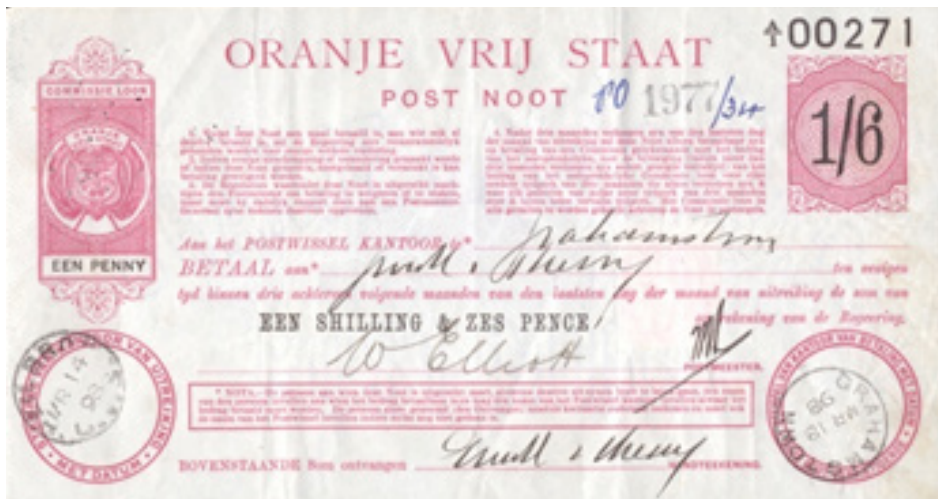
Figuur 6: Vrystaatse Posnoot, 1898