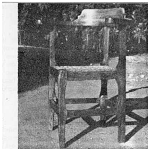
Die James Smith hoekstoel. Die meubelmaker het heelwat van hierdie stoele, onder meer vir ondernemings as kantoormeublement, gemaak.