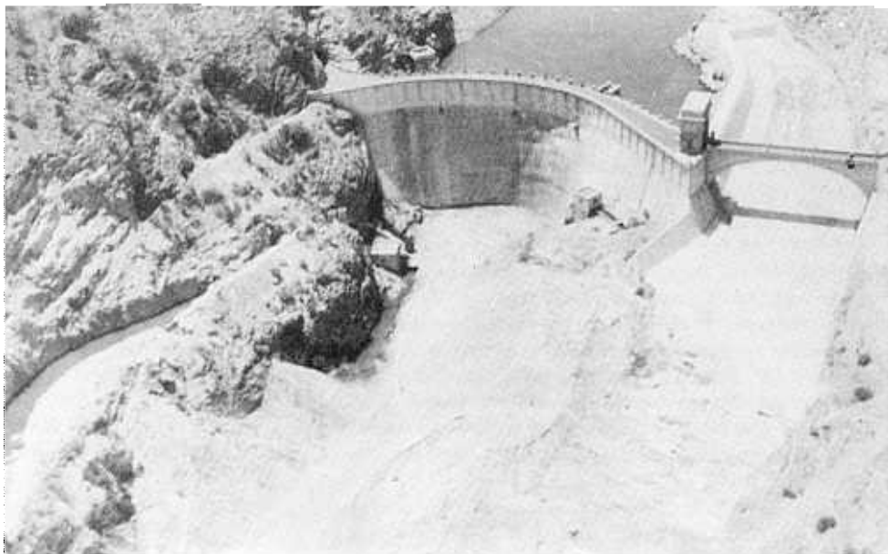
Die voltooide Hartebeespoortdam.

Sedert die totstandkoming van die nedersetting was daar 'n gestadige vooruitgang in ekonomiese aktiwiteite, hoewel aansienlike staatsonkoste aangegaan is om die skema lewensvatbaar te hou en te dien as bewys van die onderskeie regerings se noue betrokkenheid en voortgesette steun aan armlankes in die landbousektor. Indien gekyk word na die aard en ontwikkeling van die skema kan onomwonde gestel word dat dit bykans onmoontlik was dat dit winsgewend bedryf kon word. Die Hartebeespoortdamskema het begin as 'n nedersettingskema vir die hervestiging van kapitaallose, hawelose armlankes. Die verwagting is aanvanklik gestel dat die skema betalend sou wees aangesien hoewes teen realistiese pryse aan nedersetters verkoop sou word. Realiteite en politici se vooruitskouinge het egter nie ooreengestem nie. Verliese op staatsuitgawes sluit nie net direkte verliese op konstruksiewerke, grond en verbeterings in nie, maar ook waterbelasting, depresiasie, ensovoorts. Teen Maart 1929 het die Departement Lande 'n netto verlies van R47 989 gely, in 1938 is R51 484 kwytgeskel en teen 1940