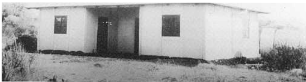
'n Huis van Departement Arbeid, ongeveer 1925.