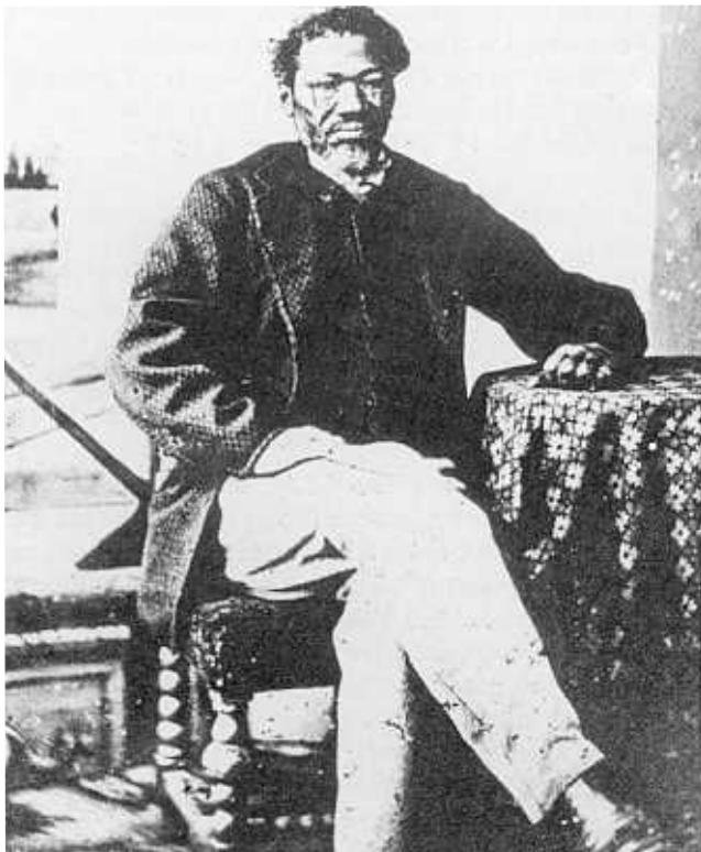
Adam Kok III

Die noordwestelike Transgariëp is vanaf die dertigerjare van die negentiende eeu toenemend deur nuwe intrekkers – blanke veeboere uit die Kaapkolonie – bevolk. Teen 1832 is die getal blankes in die Transgariëp reeds op 1500 geskat. Vanaf 1836 het die Voortrekkers ook deur die gebied beweeg en in toenemende getalle hulle daar gevestig. Daarby het die eerste sendelinge van die Berlynse Sendinggenootskap hulle in 1834 by Bethanie, in die hart van die Koragebied gevestig. 34