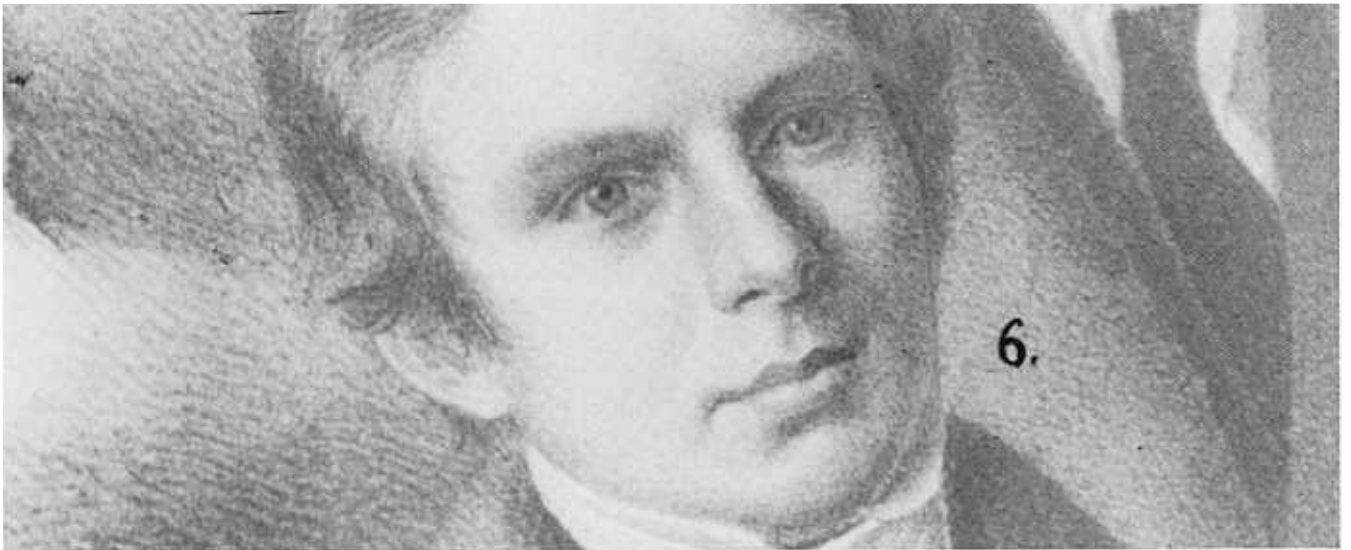
Sendeling C.F. Wuras van die Berlynse Sendingenootskap

In 1858 het Goliat, grondloos en onder druk van sy mense probeer om sy besitreg op Bethanie – 'n ou geskilpunt tussen hom en die sendelinge – deur die Vrystaatse regering erken te kry. 52 Die Volksraad het egter die reg van die Berlynse Sendinggenootskap op die gronde erken en herhaalde pogings van Goliat daarna om sy ou gronde weer op te eis, het misluk. 53 Soos in die geval van Danster het Goliat se mense verdeel geraak. Sommige het op Bethanie onder toesig van die sendelinge gebly, andere het op oop gronde 'n heenkome probeer vind of hulle as arbeiders aan blanke boere verhuur.