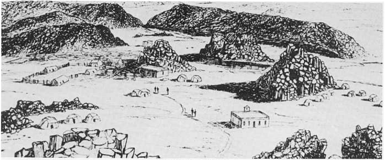
Die sendingstasie Bethanie

Vir die Kora was dit nou ook nie meer moontlik om hul ou swerwersbestaan te voer en hulle op enige gronde te vestig nie. Klagtes van Kora wat op blanke grond plak, vee steel en gewelddadig optree het veral uit die gebied tussen die Modder-en Vaalrivier gekom. Ook aan die Sandrivier het Kora hulle op blankes se plase gaan vestig, tuine verniel en selfs vrugtebome afgekap om veekrale mee te maak. 43 Die blankes het gedreig om die "indringers" met wapengeweld te verjaag.