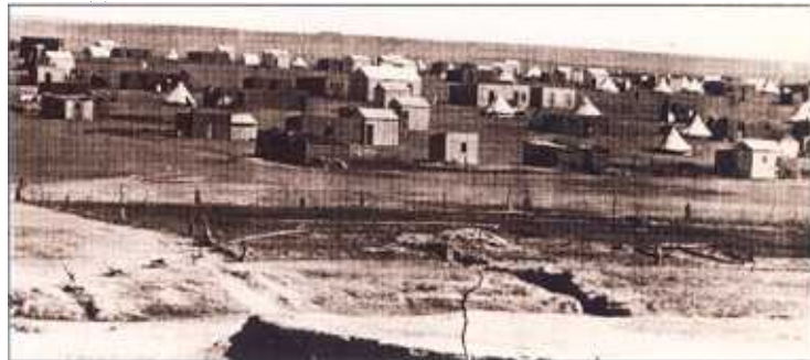
Gedeelte van Mushroom Valley-kamp. Die eenvoudige sooi- en baksteenhutte is opvallend.

gin, terwyl die kamp by Parys in Desember tot stand gekom het. In Mei 1903 is 'n aantal werkers wat aan die Wilgerivier-spoorlyn gewerk het in Glenlennie-kamp hervestig. 10