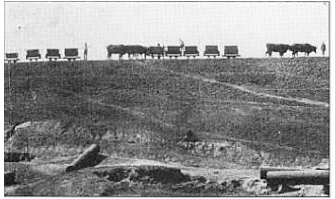
Osse en muile is gebruik om die smalspoorkoekepanne te trek.