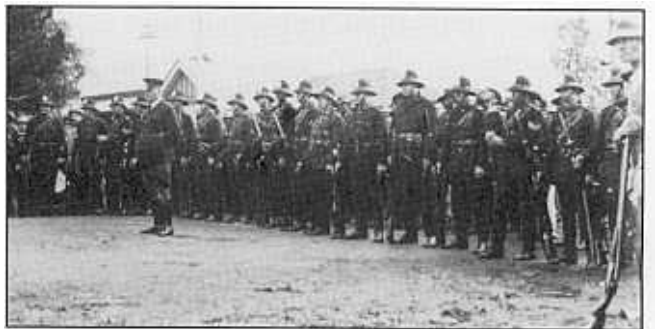
Die polisie, met lt-kol. G.S. Beer voor, neem stelling in.

Maandagmiddag het die polisie die oproermakers gewaarsku om te verdaag, aangesien hulle die bepalings van die Wet op Oproerige Byeenkomste (No. 27 van 1914) oortree. Hulle het naamlik sonder magtiging van die plaaslike landdros vergader, die openbare veiligheid in gevaar gestel en die oggend ook swart werkers deur intimidasie verhinder om te gaan werk. Die oproermakers het die stadsraad en polisie se versekering dat hulle eise om hersiening van die sorghumbierregulasies en loonkerf ondersoek sou word, verontagsaam. Hulle het daarop aangedring dat die polisie hulle onttrek — iets wat om openbare veiligheidsredes geweier is.