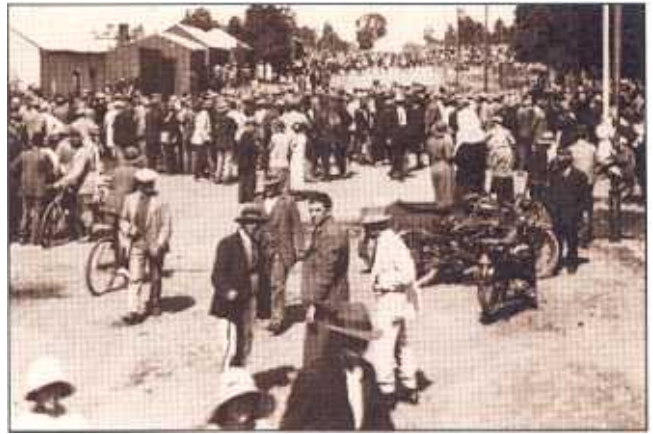
Die oproermakers in die agtergrond by die ingang na Waaihoek teenoor die blankes in die voorgrond.

Die optrede en goeie oordeel van die polisie in die oproer is egter bevestig. Die Kommissie van Onderzoek en lede van die munisipale Naturelle-advieskomitee het gemeen dit was 'n oordeelsfout om die spesiale konstabels met pikstele