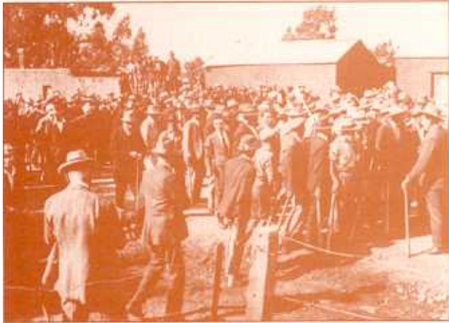
Blanke piksteelkommando vergader in Harveyweg by die ingang van die swart woongebied.

Die houding van die oproermakers het so dreigend voorgekom dat die polisie besluit het om ingevolge die Wet op Oproerige Byeenkomste burgerlikes as spesiale konstabels en konstabels van die Regiment Spoorweë en Hawens te koopsteer om die opstand te beëindig. Die spesiale konstabels wat in die voorste gelid marsjeer het, was slegs met pikstele bewapen. In die skermutseling wat Maandagmiddag gevolg het, is vier swartes doodgeskiet en 24 gewond. Een swart en twee wit konstabels is ernstig gewond en sestien lig beseer terwyl 148 swartmans en 27 swartvroue op aanklag van openbare geweld gearreesteer is. 4