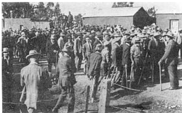
'n Blanke piketsteekommando vergader by die ingang van Waaihoek tydens die 1925-onluste.

Die opstand, wat twee uur van geweld, vyf dooies en 24 gewondes opgelewer het, het gespruit uit die algemene ontevredenheid van die swart inwoners met die ontoereikende lone van Bloemfontein se swart werkers. Hoewel die adviesraad hom vir hoër lone beywer het, bestaan daar geen afdoende bewys dat die raad of enige van sy lede by die loonvraagstuk as oorsaak van die opstand betrokke was nie. 35 Die vraag is wel of die adviesraad nie 'n beduidender rol kon speel in die bekamping van die onwettige bierbrouery nie, aangesien die munisipale regulasies vir sorghumbier die onmiddellike aanleiding tot die opstand was. 36 Die interpretasie van die munisipale sorghumbierregulasie en die bekamping van onwettige bierbrouery was besondere take van die raad. In die raadsnotule word geen aanduiding gevind dat die taak voor die 1925-opstand uitgevoer is nie. Die bestuurder van die Departement van Naturelle-administrasie en die stadsraad het trouens getwyfel of die raadslede hulle plig in dié verband nagekom het omdat hulle nog nie geskool was om volle mede-verantwoordelikheid vir gemeenskaplike belange te aanvaar nie. Volgens die bestuurder van Naturelle-administrasie moes Bloemfontein se inwoners self ook groter erns in hulle keuse van raadslede aan die dag gelê het. 37