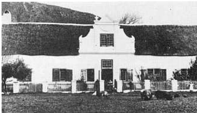
Opstal van La Provence, een van die vroegste Hugenoteplase.