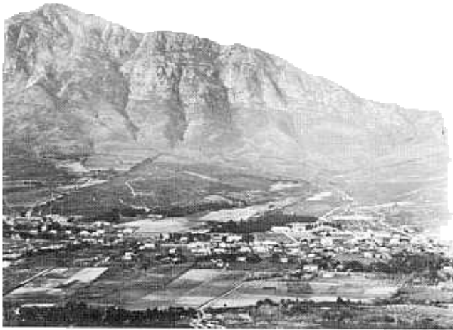
Vroeë foto van Franschhoek.