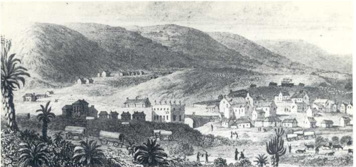
Bethelsdorp gedurende die 1820's.