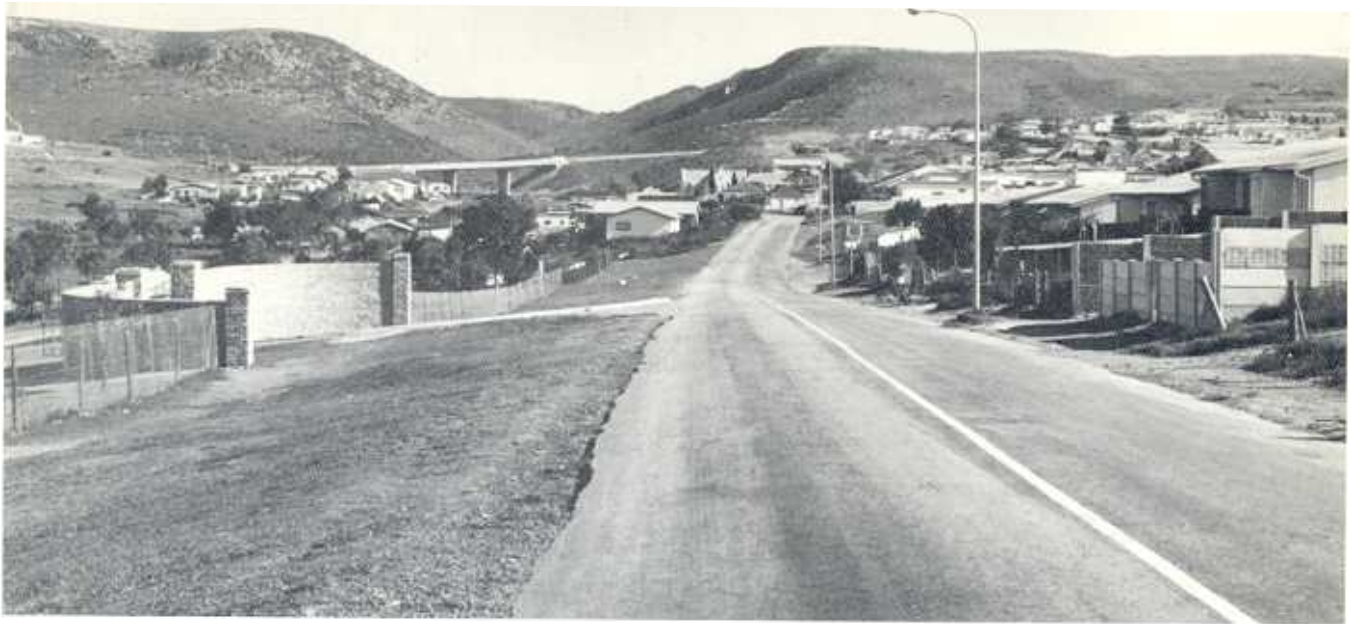
'n Moderne blik op Bethelsdorp. In die agtergrond is die kloof waar die inwoners destyds tuine gehad het.