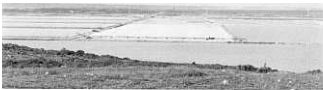
Deel van die soutpan soos dit tans daar uitsien.

Die enigste beskikbaarstelling van nuwe erwe tussen die oorspronklike opmeting in die 1870's en 1945 het gedurende die jare dertig 'n werklikheid geword. Die kwessie van grondbesit en botsende aansprake deur die LSG en CUSA is finaal gereël deur Wet 34 van 1921, ook bekend as die Bethelsdorp Skikkingswet. Dit het onder meer bepaal dat die 34 erwe by die soutpan, wat reeds in 1876 opgemeet en