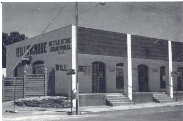
Die dokumente was in die solder van hierdie gebou. Toe verbouings in 1984 aangebring is, is die solder afgebreek.*