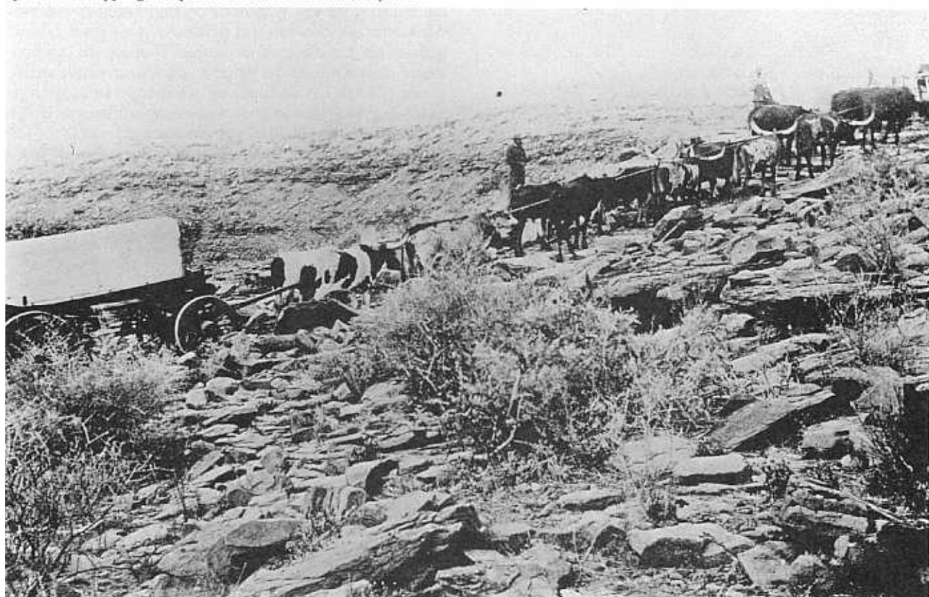
Op die droë, klipperige trekkpad in die suide van Suidwes-Afrika.