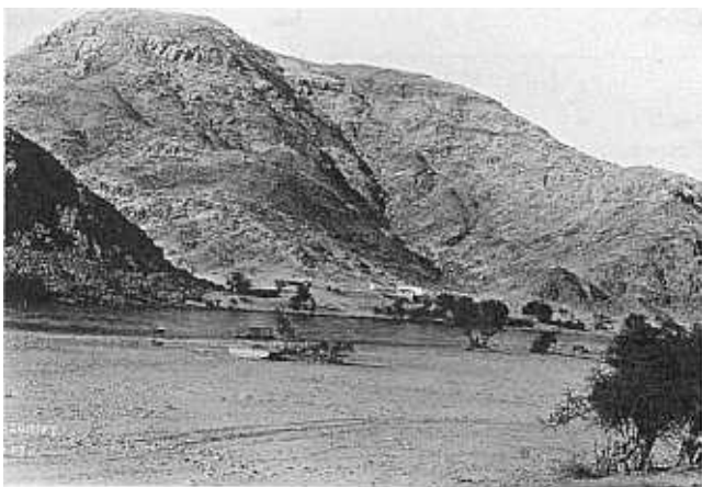
Ramansdrif, 'n bekende oorgang oor die Oranjerivier vir trekkers onderweg na Suidwes-Afrika.*

Alhoewel daar 'n sporadiese invloed van Blanke boere in Suidwes-Afrika was gedurende die maande (Februarie-Julie 1915) van militêre aksie het die werklike groot en onbeheerde invloed eers ná die ondertekening van die akte van oorgawe te Khorab op 9 Julie 1915 plaasgevind. Aangesien die Duitse instromingsbeheermaatreëls nie meer van krag was nie, het boere uit die Unie, 5 en veral vanaf die noordwestelike dele van die Kaapprovinsie, van die kans gebruik gemaak om na Suidwes-Afrika te gaan.