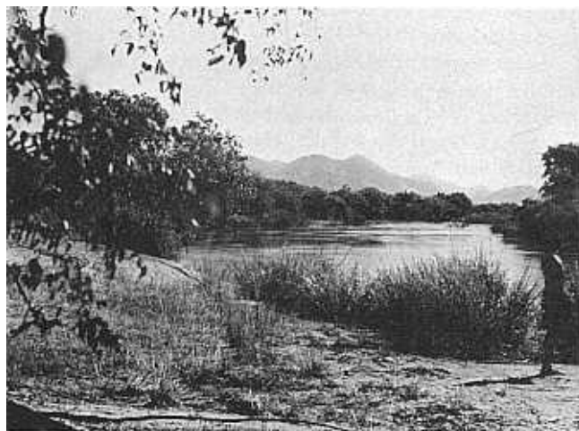
Swartbooisdrif in die Kunenerivier waar die Angola-boere Suidwes-Afrika gedurende 1928-1929 binnegetrek het.

Die Angola-boere was nasate van die Dorslandtrekkers wat gedurende die laaste kwart van die vorige eeu uit Transvaal deur die Kalahari na Suidwes-Afrika getrek het. Ná verskeie mislukte pogings om permanente verblyf in Suidwes-Afrika te verkry, het die Dorslandtrekkers hulle uiteindelik in 1881 in Angola gevestig en vir byna 50 jaar hier gewoon. Die belangrikste nedersettingsentra was Humpata, Que, Cacon-