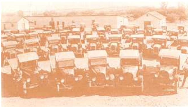
Van die vragmotors waarmee die Angola-boere en hul besittings na Suidwes-Afrika vervoer is.

Veeverliese onder die Angola-boere in die Gobabisdistrik was so groot dat daar in 1936 slegs sowat 4 000 beeste oor was. In 1929 het die Suidwes-Administrasie ongeveer 4 400 beeste aan die verskillende Angola-boere verskaf. Oor 'n tydperk van sewe jaar het daar dus, ten spyte van die natuurlike aanwas, 'n daling in die totale aantal beeste van die Angola-boere voorgekom. 32