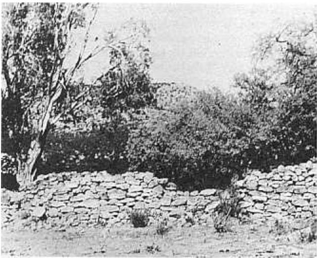
Oorblyfsels van die Dorslandtrekkers se kerkgebou op Kaoko-Otavi in die Kaokoveld.

Tog het die skema op die kort termyn beslis nie aan die verwagtinge voldoen nie. In 'n verslag van die Landnedersettingskommissie in 1935 is die verkwisting van geld, die vestiging op "ongesonde" plase en die voorsiening van duur en minderwaardige aantelwee skerp veroordeel. Die verslag het voorts verklaar dat Angola-boere se plase tekens van agteruitgang getoon het. By sommige boere self kon 'n mate van morele en geestelike insinking bespeur word. In terme van bestendigheid was daar geen vooruitgang onder die