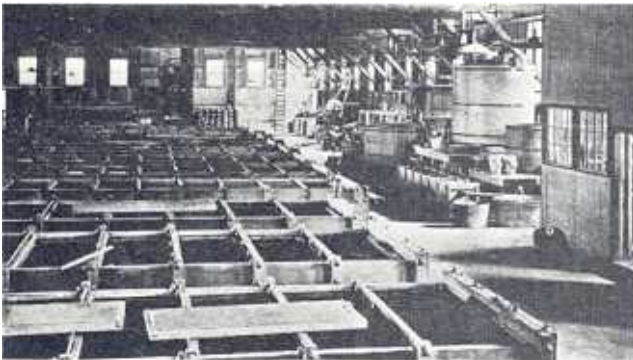
Langlaagte Deep Gold Mine — "moderne" apparaat vir die berwinning van goud.

Hierdie instellings wat vir alle praktiese doeleindes beheer oor die goudmynbedryf gekry het, was in die hande van enkele kapitaalkragtige persone soos Alfred Beit, Julius Wernher, Hermann Eckstein, Lionel Phillips, Cecil John Rhodes en J.B. Robinson. 22 Daardeur is dit moontlik gemaak om die vraagstukke waarmee die goudmynbedryf te kampe gehad het, op die mees doeltreffende manier op te los. Die feit dat goud nie-mededingend bemark kon word omdat die wêreldprys daarvan op £4,247727 per fyn ons vasgepen was, 23 het verder daartoe bygedra dat ondernemings wat normaalweg met mekaar sou wedywer, kon saamwerk om die bedryfskoste van die goudmyne so laag as moontlik te hou.