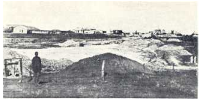
Mynbou-aktiwiteite by Natalspruit, Johannesburg, met uitgrawings duidelik sigbaar in die voorgrond.

Alle probleme waarmee die goudmynbedryf rekening moes hou, was ondergeskik aan een sentrale vraagstuk, naamlik die beskikbaarheid van voldoende hoeveelhede ekonomies ontginbare gouderts. In die jare negentig is reeds met behulp van omvattende diepvlakprospektering vasgestel dat die goudertsreserwes besonder groot is en dat die goudinhoud daarvan net minimaal afneem namate dieper gedelf word. 26 Myningenieurs het eintlik met mekaar gewedywer