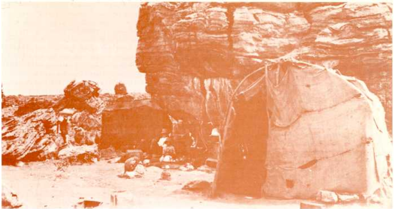
'n Sakkaia en rotsskuiling van 'n brandarm delwersgesin.

posisie op die delwerye te verbeter, het die meeste van hierdie mense verder verarm en 'n groot las vir die staat geword. Dit was feitlik 'n onbegonne taak om diegene wat geen bestaan op die delwerye kon maak nie, daarvandaan weg te kry na plekke waar hulle van werk en 'n inkomste, hoe karig ook al, voorsien kon word. Die lewe op die delwerye was goedkoper as in 'n stad of dorp. Die voedselrantsoene van die staat en ander hulp van welsynsorganisasies het demoraliserend op sommige van die armlastige delwers ingewerk sodat hulle niks meer wou doen om hulself te help nie. Werksgeleenthede wat hulle aangebied is, is van die hand gewys of ongunstig ontvang aangesien dit harde werk onder iemand anders se toesig beteken het — iets waaraan die delwers nie gewoon was of van gehou het nie.