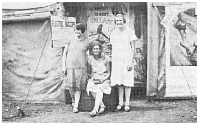
'n Paar dames voor een van die bioskope op die Lichtenburgdelwerye.

hulle was van sonop tot sononder op die kleims besig. Dit was die patroon vir vyf dae van die week maar sommige delwers het Saterdag ook gewerk. Sondag is egter gerus. Vir die meeste delwers was Vrydae en veral Saterdag die dag waarop die week se opbrengs verkoop en inkopies gedoen is. Die delwers het hul inkopies by die delwerye gedoen of na Lichtenburg gegaan waar noodsaaklikhede en soms selfs luukse goedere gekoop is. Delwers het die dorp gedurigdeur besoek en gewoonlik 'n draai by die hotel gemaak. Die kroë was altyd vol. 38 Die wat dit kon bekostig, het naweke op uitstappies na byvoorbeeld die Molopo-oog of Johannesburg gegaan. Namate armoede onder die delwers toegeneem het, het dié uitstappies verminder. 39