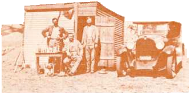
'n Sinkkaja met sy inwoners op Bakers

week by 'n apteek op die delwerye was waar hulle siekes gehelp het en teen 'n fooi van 10/6 ook pasiënte tuis besoek het. 4 Die naaste hospitaal was die "Cottage Hospitaal" in Lichtenburgdorp met net ses beddens vir Blankes. Daar was geen hospitaal vir Swartes in die distrik Lichtenburg nie en hulle moes na hospitale in buurdistrikte gestuur word. Voor die uitbreek van die maagkoors het die Lichtenburgse delwerskomitee begin geld insamel en onderhandelings met die TPA en die departement van Mynwese aangeknoop vir die oprigting van 'n hospitaal op die delwerye. Eersgenoemde wou egter nie die uitgawe aangaan nie aangesien die TPA geen belasting van die delwers ontvang het nie. Die departement van Mynwese was op sy beurt nie seker of dit sy verantwoordelikheid was om mediese fasiliteite op die delwerye te voorsien nie.