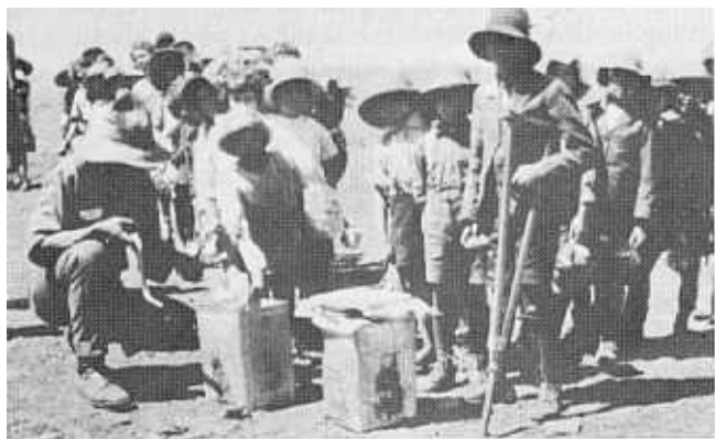
Voedseltransjoene word aan skoliere by Ruigtelaagte uitgedeel.

Die jaarlikse skoolbywoning het baie gewissel veral aangesien delwers geneig was om op die delwerye rond te trek. Dit was dus baie moeilik om kontrole uit te oefen oor die skoolpligtige kinders en diegene op te spoor wat nie skoolgegaan het nie. Wanneer dit ekonomies beroerd met die delwers gegaan het — veral tydens die depressiejare — moes die kinders soms uit die skool wegbly om op die kleims te gaan help. Onverskilligheid aan die kant van ouers het voorts daartoe gelei dat baie delwerskinders nooit skoolgegaan het nie. Volgens ds. Du Toit was daar in 1927 tussen 6 000 en 7 000 kinders van skoolgaande ouderdom op die delwerye wat nie 'n skool bygewoon het nie. 28 By dié wat wel by skole ingeskryf was, was die skoolbesoek redelik bevredigend en selfs baie goed. In 1927 was die gemiddelde skoolbesoek vir die laaste kwartaal byvoorbeeld 74,6 %, terwyl die gemiddelde skoolbesoek vir 1931 so hoog as 95 % was. 29 'n Onderliggende rede vir die hoë skoolbesoeksyfer kon die feit wees dat leerlinge — veral gedurende die wintermaande — by die skole warm klere en voedsel soos sop, melk en kaas ontvang het wat deur die staat en welsynsorganisasies verskaf is.