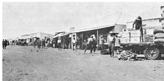
Straatoneel (met enkele besighede) in Bakers.

Ten spyte van die groot en gevarieerde gemeenskap op die delwerye en die voorkoms van misdaad was die delwersgemeenskap redelik ordelik en rustig. Die grootste persentasie oortredings wat gepleeg is, was nie eintlik ernstig van aard nie. Verskeie besoekers aan die delwerye het juis opgemerk dat die bevolking aldaar besonder wetsgehoorsaam voorgekom het. 52