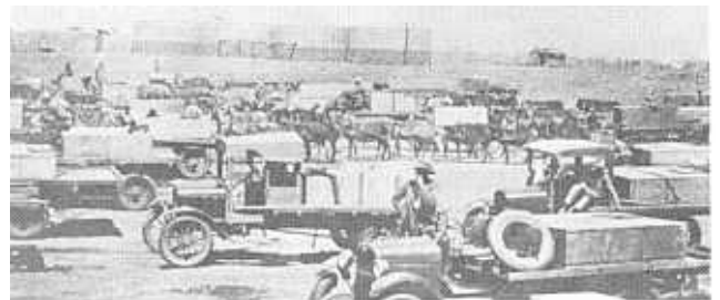
'n Waterstasie op Bakers.

Die sink-en-houtgebou was 'n verbetering op die tente, maar die toerusting van die hospitaal was baie swak. Net die minimum mediese voorraad en toerusting was beskikbaar. Toestande in die afdeling vir Swartes was ook uiters swak. Die tente was oud en stukkend, nie stofdig nie en het gelek wanneer dit reën. Bowendien was dit gedurende die winter baie koud en in die somer erg warm daarbinne. Daar was nie genoeg beddegoed en matrasse vir al die beddens nie en die beskikbare voorraad was oud en vuil. In 1928 het die departement van Mynwese geld bewillig om die afdeling vir Swartes op te knap en teen 1930 was die tente met 'n sink-en-houtgebou vervang. Die volgende jaar het die tente van die isolasihospitaal ook vir sinkgeboue plek gemaak en is 'n primitiewe operasietheater by die hoofhospitaal ingerig. 14 Sodoende het die veldhospitaal sy