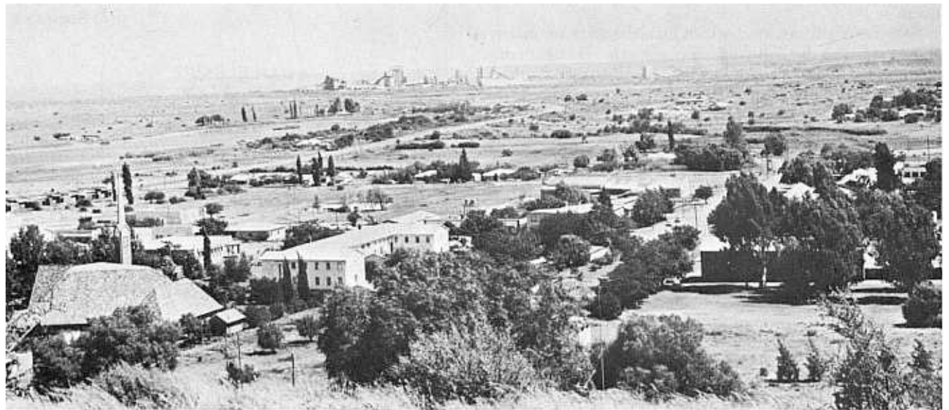
'n Gedeelte van die Noord-Kaaplandse dorp Danielskuil.

Twee weergawes van die beweerde oorsprong van die naam Danielskuil is egter wel opgeteken. Toe sendelinge van die Londense en Wesleyaanse sendinggenootskappe in