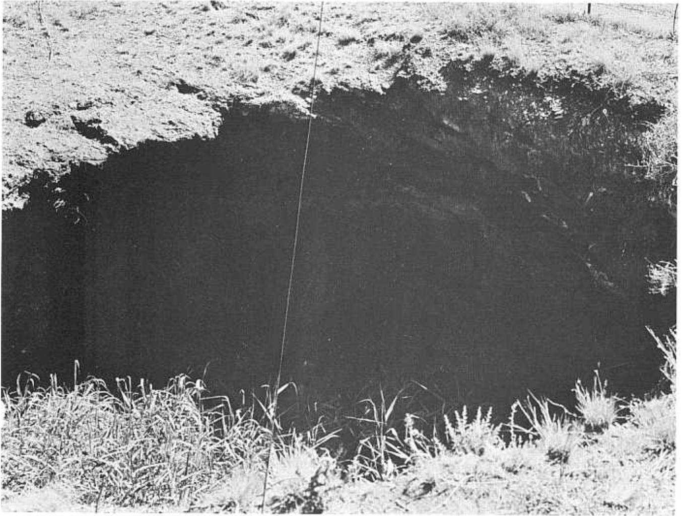
Die kuil in die kalksteenformasie op Danielskuil se dorpsmeent.