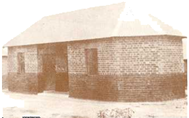
'n Voorbeeld van Gekleurde-behuising in die "Nuwe Lokasie" by Pretoria (1914).

verhoog. Nieteenstaande die tuberkulosekommissie se lof was die huise egter nie sonder foute nie. Om genoegsame ventilasie te voorsien, is openinge tussen die mure en die dak gelaat — 'n feit wat bewoning in die wintermaande baie onaangenaam gemaak het en die inwoners genoop het om dit met modder toe te stop. In April 1914, toe die huise maar pas voltooi was, het die mure as gevolg van stormwater wat daarteen opgedam het, begin kraak. 25