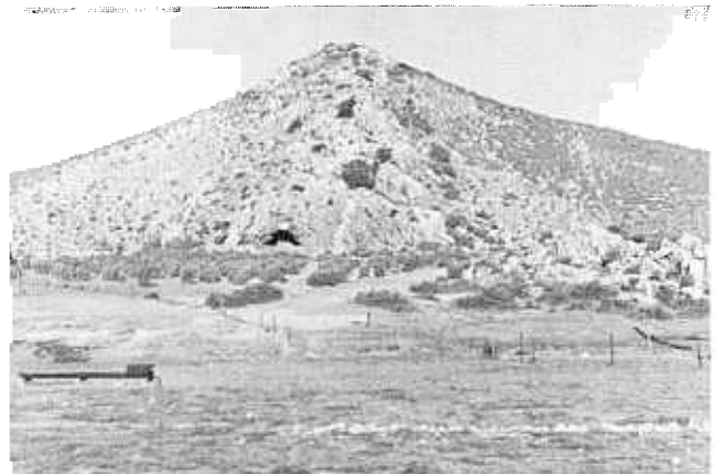
'n Onlangse foto van Meerhoffkasteel.

Kort na die slag by Meerhoffkasteel het die Boesmans as faktor uit die Hardeveld verdwyn; hoewel verskeie bekende plase in die naburige Onder-Olifantsrivier teen 1750 op lening uitgegee was, is die eerste drie Hardeveld-plase eers in 1770 aangeteken. Die onherbergsame en waterlose Hardeveld het veeboere gedwing om liever na die Kamiesberge en die Hantam uit te wyk waar die klimaat en ander omstandighede veel gunstiger was.