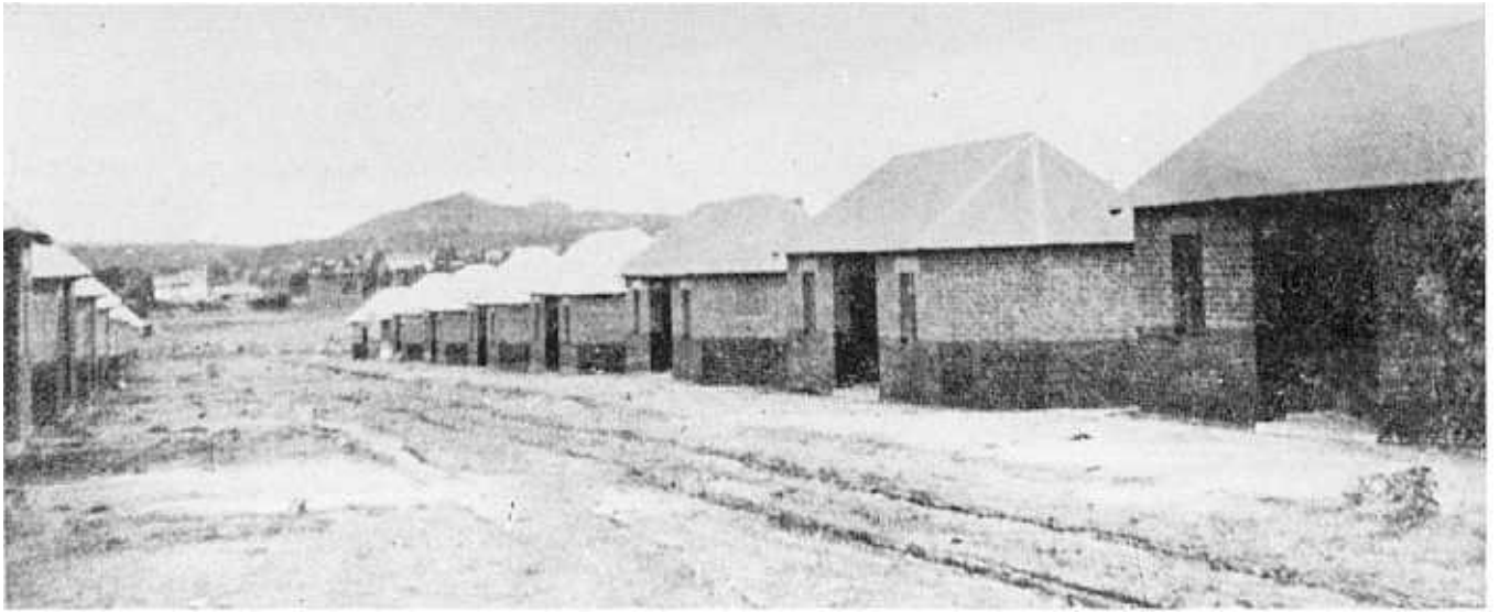
Die wonings in die "Nuwe Lokasie" het 'n kenmerkende hutvoorkoms gehad.