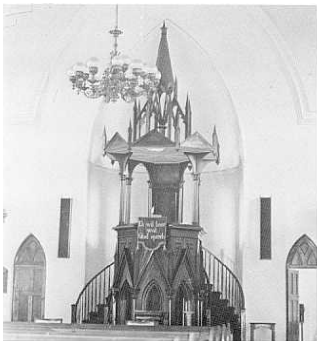
Die imposante preekstoel van die Nederduitse Gereformeerde Moeder-gemeente op Middelburg.