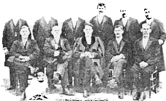
EERSTE KERKERAAD van de Gemeente Woodstock.