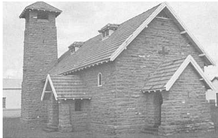
Die sierlike klipkerk van die St. Alban Anglikaanse gemeente wat deur sir Herbert Baker ontwerp is.